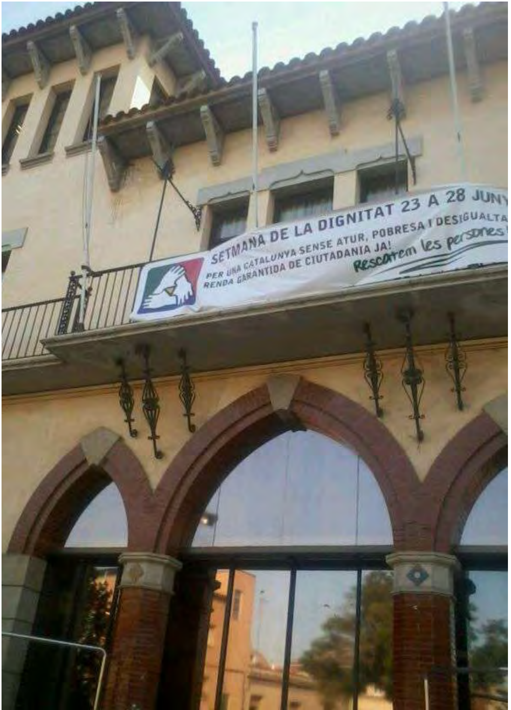
Una amplia majoria de Municipis de Catalunya va subscriure el document d'adhesió a la RGC