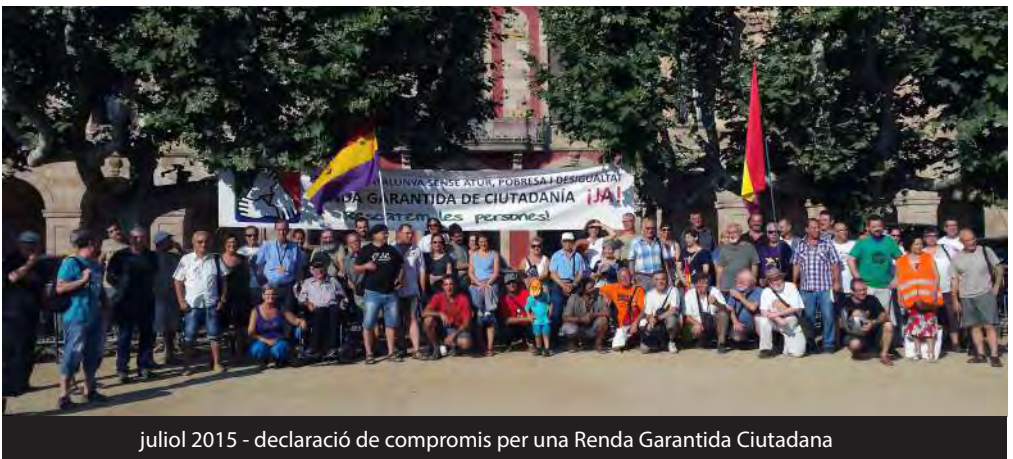
juliol 2015 - declaració de compromís per una Renda Garantida Ciutadana

Persones ingressades en centres penitenciaris.