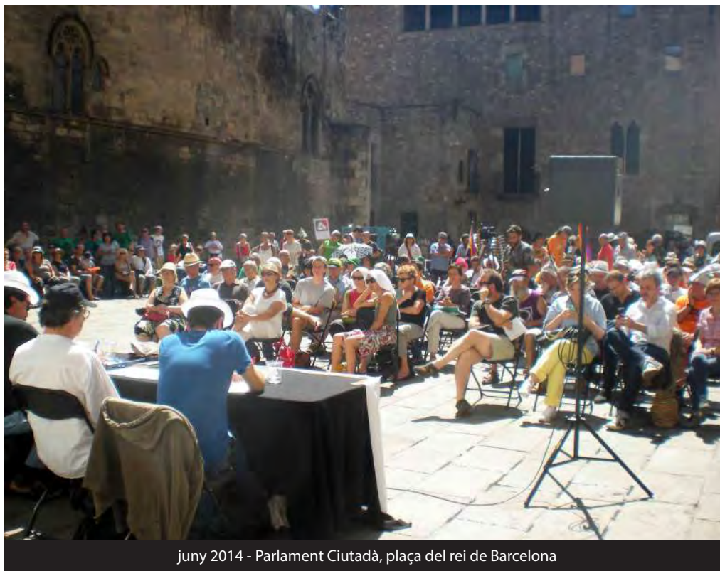
juny 2014 - Parlament Ciutadà, plaça del rei de Barcelona