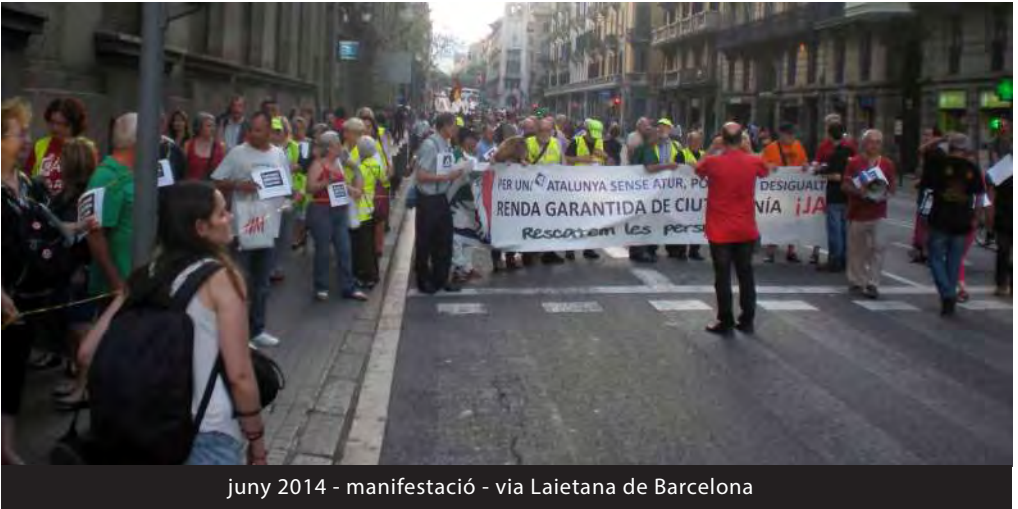
juny 2014 - manifestació - via Laietana de Barcelona

En cas de no posseir aquest carnet, s'ha de tramitar al més aviat possible, a l' Oficina d'atenció d'assumptes socials i famílies (OAF) .