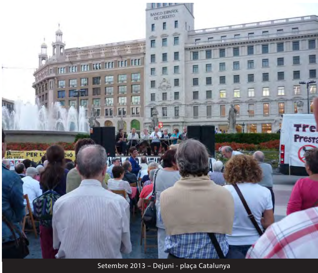
Setembre 2013 – Dejuní - plaça Catalunya

Certificat de reconeixement de la minusvalidesa, si és reconeguda en un grau superior al 65%.